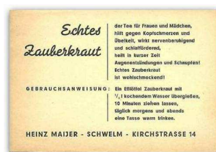
Drogerie Heinz Maijer (Am Fronhof)