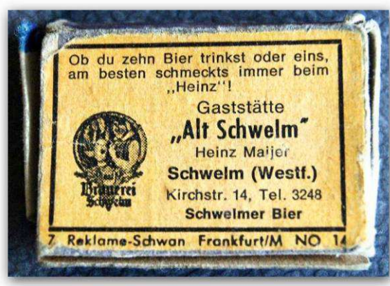
Streichholzschnitzel - Werbespruch Archiv Anita Maijer-Schrot