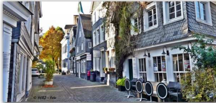
Schwelm, Kirchstraße 14 - 22