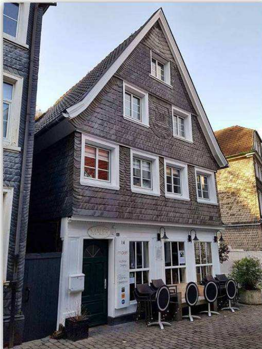
Schwelm, Kirchstraße 14 April 2017

Das Gebäude wurde 2016/17 umfangreich denkmalgerecht saniert und renoviert. Es erstrahlt jetzt wieder in neuem Glanz, ein Schmuckstück mehr in der Kirchstraße.