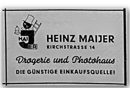
Werbeanzeige: 1. Kirmeszeitung 1949