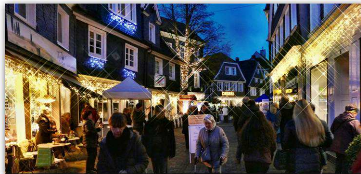
- Weihnachtsbeleuchtung 2016 - Kirchstraße